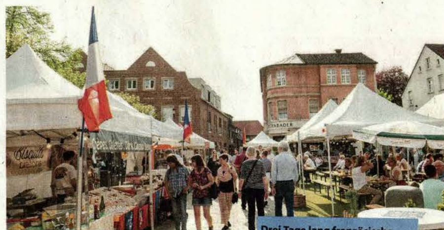
Drei Tage lang französische Spezialitäten auf dem Markt- platz direkt genießen oder mit nach Hause nehmen.

So findet der Besucher etwa Käse aus der Auvergne und dem Baskenland, Oliven und Trockenfrüchte aus dem Süden der Republik, außerdem Brot und andere Backwaren, Wurstspezialitäten, Arganöl oder exklusive Körperpflegemittel. Eine erlesene Auswahl französischer Weine lässt sich direkt an Ort und Stelle verkosten, am besten bei Flammkuchen oder