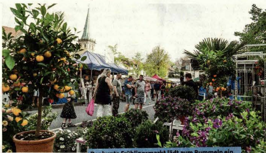
Der bunte Frühlingsmarkt lädt zum Bummeln ein. Auch die Geschäfte sind geöffnet.

Bei „Lüdinghausen mobil“ dreht sich am Samstag, 23. April, zwischen 10 und 15 Uhr alles rund um die Themen Fahrradfahren und Mobilität. Im Rahmen des Lüdinghauser Frühlings werden auf der Wilhelmstraße verschiedene Info- und Aktionsstände aufgebaut. Besonderes Highlight: Eine mobile Fahrradwaschanlage. Hier können die Besucher ihr Rad gegen eine Spende reinigen lassen. Der Erlös der Aktion geht an einen guten Zweck. Der ADFC informiert über Radfahren in Lüdinghausen und Verkehrssicherheit auf dem Rad. Die Stadt Lüdinghausen hat ebenfalls allerlei Infos mit im Gepäck und weist schon mal auf das „Stadtradeln“ vom 1. bis 21. Mai hin. Lasten-E-Bikes können begutachtet und Dreiräder für Erwachsene ausprobiert werden. Der RVM und der Naturpark Hohe Mark sind mit Infomobilen vor Ort, ebenso der Verein „Bürger für Bürger“, der sein Rikscha-Projekt vorstellt. Wer sich mit seinem Fahrrad vor toller Lüdinghauser Kulisse fotografieren lassen möchte, der ist bei der AGFS richtig.