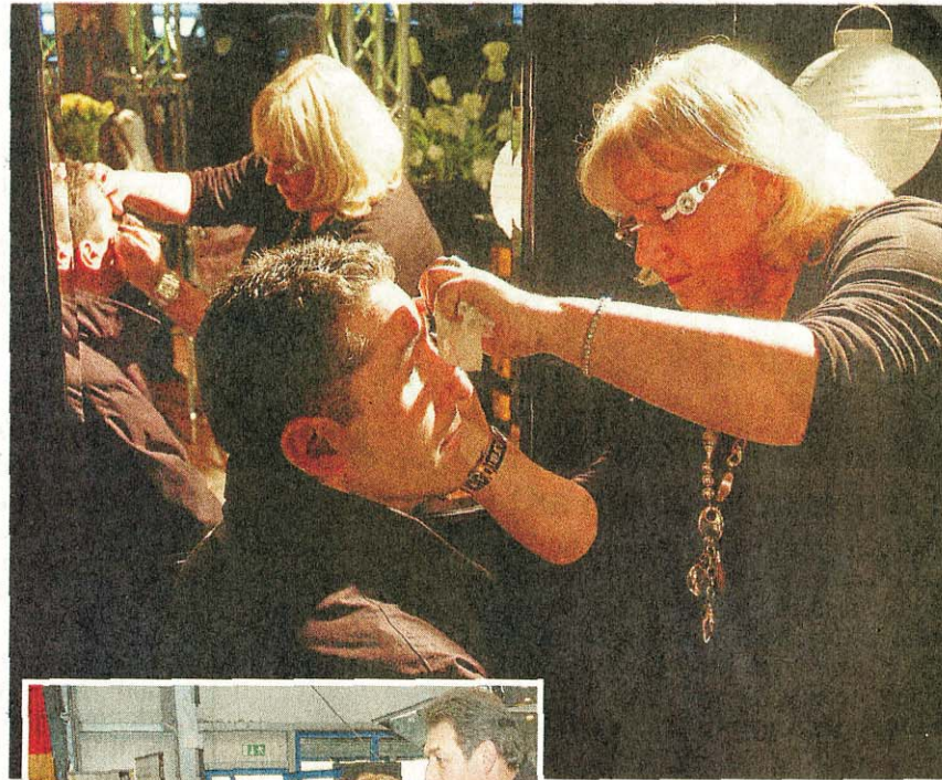
Filigranes für Männergesichter.

Das Autohaus Schröder zeigte natürlich technisches, Kranefuß, Ulla's Team, InStyle Kosmetik, Blumen Heitmann, Reisebüro Nitsche, Versicherungsbüro Neve, Raiffeisen und Bose reihten sich aneinander. Auf der anderen Seite ging es mit Bücher Schwalbe, Optik Fischer, Schuh Neuhäus, Ricordo, Dannemann