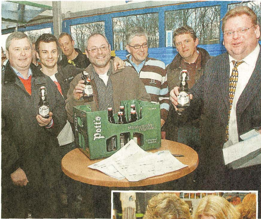
Die Männer erkannten Biersorten.

Messe für den Mann legt in der Autowerkstatt Schröder eine gelungene Premiere hin