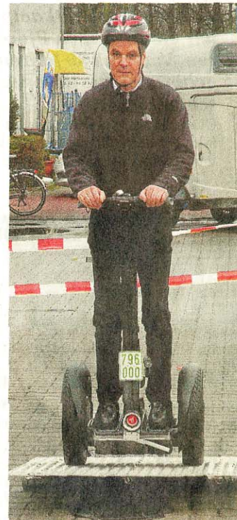
Die Segways lockten Mann zu einer Probefahrt.

Videonachrichten von WN-TV auf westfaelische-nachrichten.de/wntv