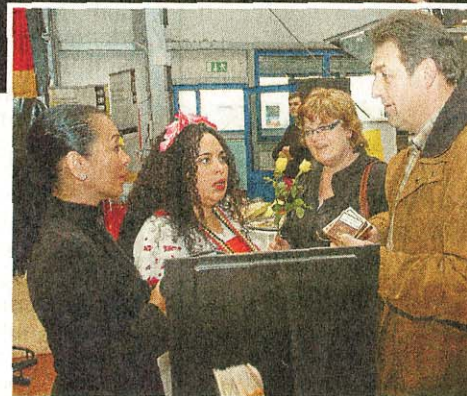
Im Autohaus Schröder fanden alle Besucher Interessantes für sich.

Cigarren und Elkes Wäschemoden weiter. Der Mixed machte den Rundgang besonders interessant. Vertreten waren auch Vertreter der Pfarngemeinde St. Anna Davensberg, die für den Kauf des Steinbruchs Schnaps verkaufen. Diese Messe für den Mann ruft nach der Premiere nach einer Neuauflage, denn es gibt noch Potenzial.